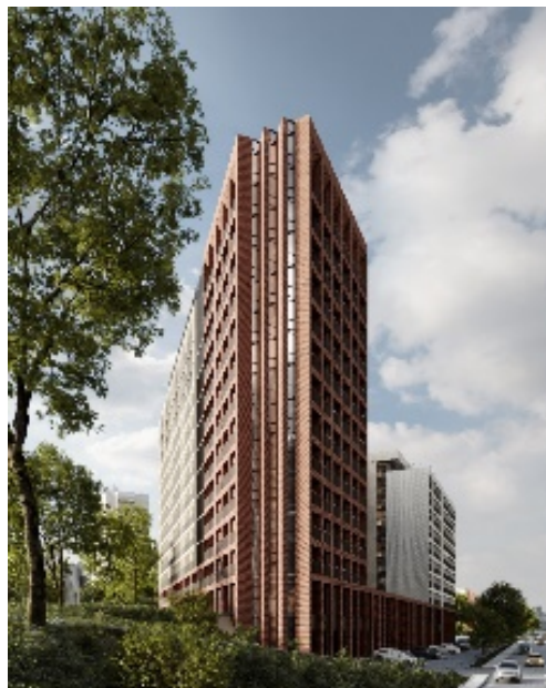
Фото: Дом-бутик «Unity Center». Источник: ngs.ru

На текущий момент портфель фонда полностью укомплектован.